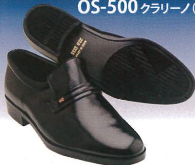
OS-500 クラリーノ (黒)

シンプルなデザインで快適さを重視した靴です。 ビジネスシューズとしてもご使用いただけます。