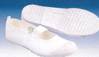
ハイスクールフローア-VK (白)